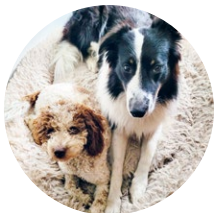
Hunde Bubbles & Timmy